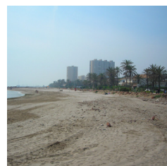
El Puig (Valencia)