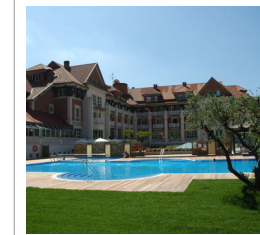
Puente Viego (Cantabria)